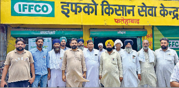
फतेहाबाद। अनाज मंडी में खाद के गोदामों को चेक करते पगड़ी संभाल जट्टा किसान संघर्ष समिति की टीम।