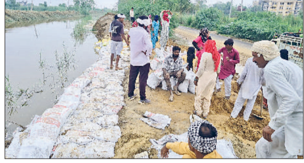
सिरसा। दड़बा कलां के पास सेमनाले में आई दरार को बांधते ग्रामीण व कर्मचारी।

चोपटा क्षेत्र से गुजरने वाले हिसार घग्गर मल्टीपरपज ड्रेन सेमनाले में चोपटा और दड़बा कलां के बीच सिरसा-भादरा रोड के पास अचानक पानी का रिसाव शुरू हो गया। तटबंध में आई दरार को भरने के लिए प्रशासन के साथ ग्रामीणों व मनरेगा मजदूरों की मदद से दरार को बांधा गया। लगातार पानी के बढ़ते दबाव से तरकावाली, शाहपुरिया व शक्कर मंदोरी गांवों में सेमनाले के तटबंध टूटने का खतरा अभी भी बना हुआ है। प्रशासन के साथ-साथ मनरेगा मजदूर तथा