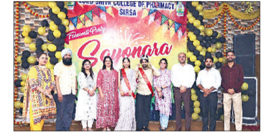
सिरसा। विभिन्न खिताबों से नवाजे गए विद्यार्थी।