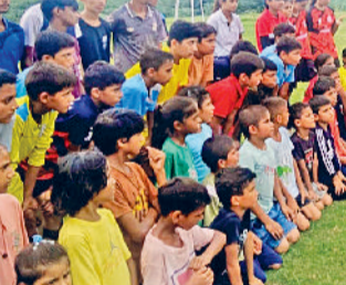
फतेहाबाद। गांव ढिंगसरा में विद्यार्थियों को जागरूक करते पुलिस अधिकारी।

आदि से कैसे सतर्क रहना चाहिए। साथ ही यह भी बताया गया कि कोई भी संदिग्ध लिंक या मैसेज मिलने पर वे माता-पिता या शिक्षक से तुरंत साझा करें। कार्यक्रम के दौरान छात्रों को गुड टच और बैड टच की अवधारणा भी विस्तारपूर्वक समझाई गई। छात्राओं को बताया गया कि किसी भी