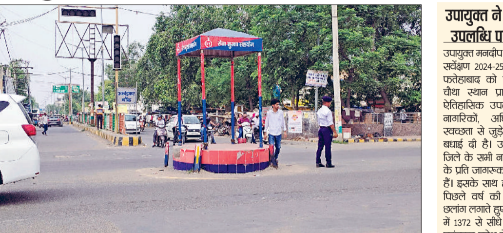
फतेहाबाद। शहर का लाल बत्ती चौक।