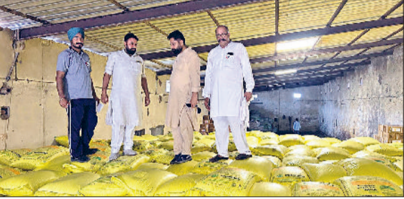
दुकानदारों को खाद व यूरिया के साथ दूसरे प्रोडक्ट देती है तो दुकानदार भी आगे जबरदस्ती किसानों को यह प्रोडक्ट लेने के लिए मजबूर करता है।