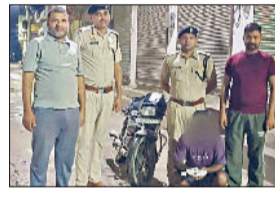
सिरसा। पकड़ा गया हेरोइन तस्कर।