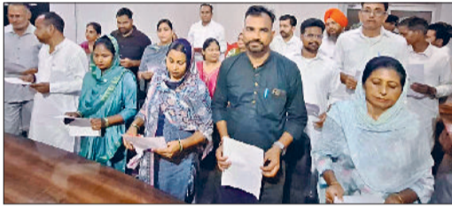
सिरसा। कालावाली नगरपालिका के नवनिर्वाचित प्रधान व वार्ड पार्षद।